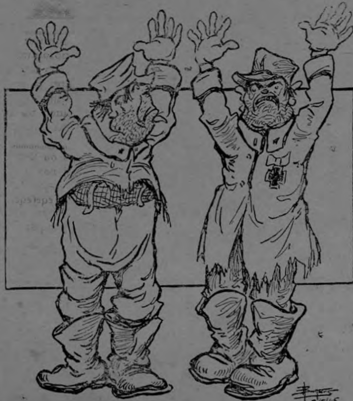
LA SUERTE ESTA ECHADA

semilla. "Hablando del maíz, por ejemplo, si éste se encuentra todavía sin desgranar, se tomarán unas cuentas mazorcas al acaso y se les quitarán a cada una de ellas algunos granos, que se quiera ensayar si la germinación resulta del 90 por ciento, o lo que es lo mismo de cada diez granos nacen nueve, quiere decir que todo el lote de mazorcas podrá ser empleado en la siembra. Si la germinación es menos del 90 por ciento es conveniente hacer un nuevo ensayo con cada mazorca para desechar las que dan un bajo rendimiento. La semilla de maíz que resultare en el ensayo con menos del 80 por ciento no deberá emplearse. "Tratándose de otras variedades de semillas debe tenerse en cuenta que algunas pueden germinar a baja temperatura, como el trigo, mientras que otras no".